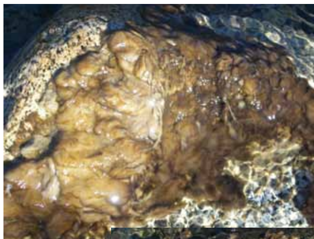
Aspecto de las masas "algodonosas" del Alga Didymosphenia geminata ( Didymo ) sobre rocas cuando produce floraciones.

Los salmónidos pueden albergar en su musculatura larvas de un parásito ( Diphyllobothrium spp. ) que tienen aspecto de gusano, son blanquecinas y de pequeño tamaño cuya ingestión por humanos provoca una enfermedad conocida como difilobotriosis. Estas larvas son difíciles de observar a ojo desnudo pero mueren si la carne de pescado se cocina adecuadamente a más de 60 grados (no vuelta y vuelta).