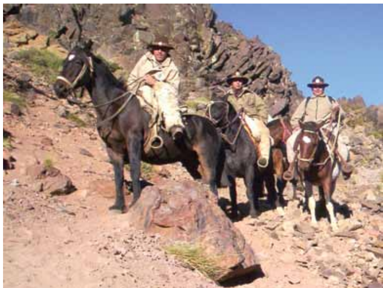
GRUPO DE GUARDAFAUNAS DEL NORTE NEUQUINO